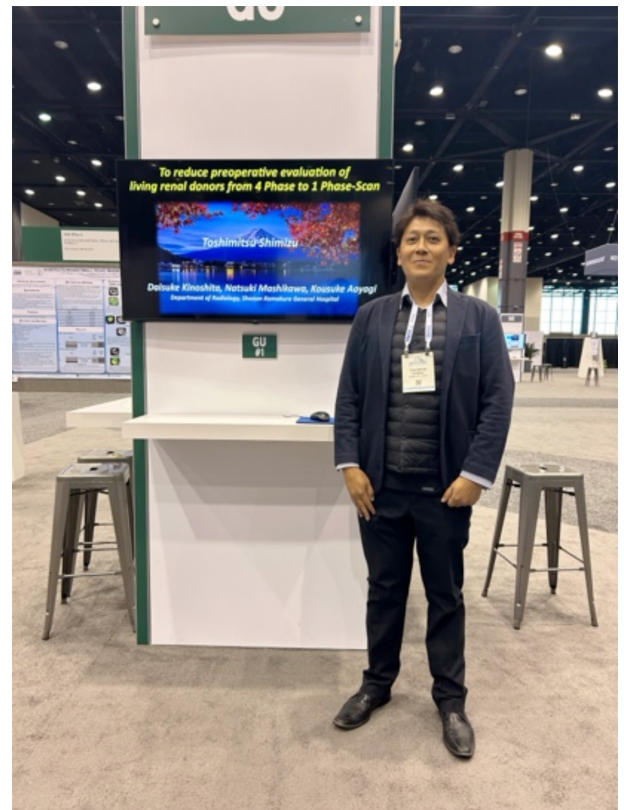
Photo RSNA 2024 電子ポスター前にて

「RSNA」でスムーズに通過できたことが印象的だった。世界中から多くの参加者が集まる中、日本からも数十名の参加者が見られた。以前から参加されている方々のご配慮により、参加者の方々とも交流を深めることができ、大変有意義な5日間を過ごすことが出来た。